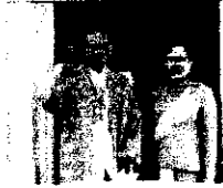
พระบรมฉายาลักษณ์