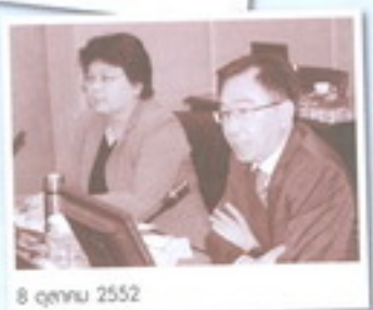
8 ตุลาคม 2552

การทดสอบการรู้ตื่นข้อมูลและระบบงานสำคัญ เพื่อให้เกิดความมั่นใจต่อการให้บริการแก่สมาชิก กบข. และการปฏิบัติงานในธุรกรรมงานที่สำคัญได้อย่างต่อเนื่อง ณ ศูนย์ปฏิบัติงานสำรอง บริษัท แมโทรพอลิตันส์ คอร์ปอเรชั่น จำกัด (มหาชน)