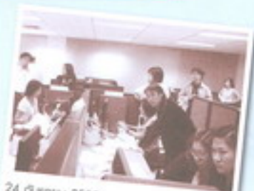
24 กันยายน 2552