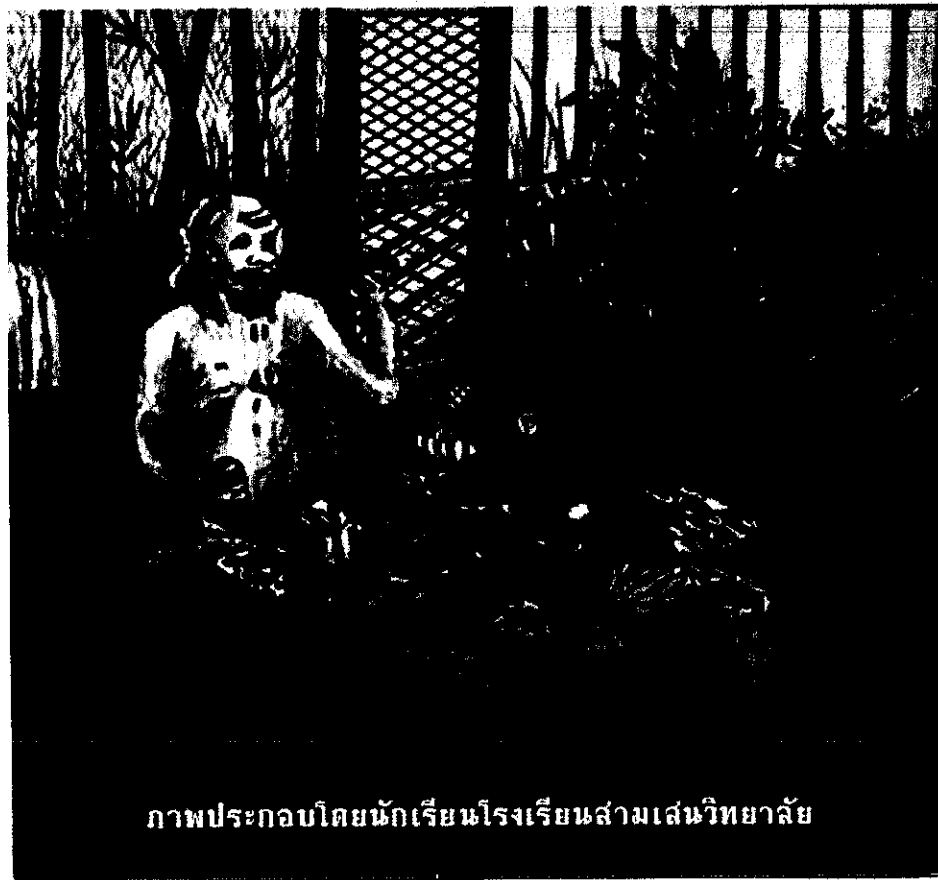
ภาพประกอบโดยนักเรียนโรงเรียนสามเสนวิทยาลัย