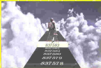
Prize Winner of the Grand Prix Japan Prize 2010, "Cosmic Code Breakers: The Secrets of Prime Numbers" (Japan Broadcasting Corporation (NHK))

An excellent proposal for a TV program, which promotes literacy and language education and which contributes to the spread of basic education.