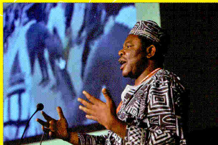
Prize Winner of the Best TV Proposal Award 2010, "Breasts torturing" (Africa Japan House Center (AJH))