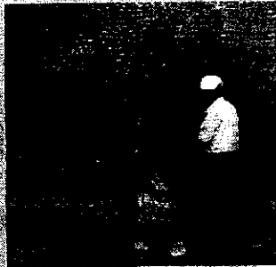
ภาพที่ ๒ - ชาวนาในสวนผลไม้