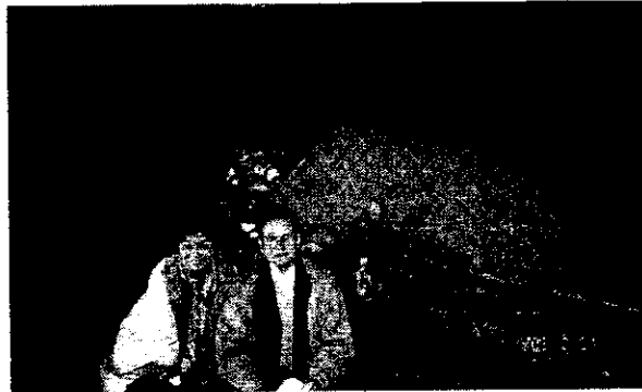
ในมหาปรินิพพานวิหาร

ณ ตรงต้นสาละคู่ที่พระบรมศาสดาเสด็จปรินิพพาน บัดนี้มี มหาปรินิพพานสถูป (ดูรูป) และที่ติด ๆ กันนั้นมีมหาปรินิพพานวิหาร เป็นภาพคู่กันคือสถูปกับวิหาร ในวิหารมีพระพุทธรูปปางปรินิพพาน ซึ่งต่างจาก “พระนอน” โดยทั่วไป “พระนอน” โดยทั่วไปเหมือน คนที่ยังมีชีวิต แต่พระพุทธรูปปางปรินิพพานนั้นคนปั้นเขาปั้นเก่ง ดูก็รู้ ว่าเป็นร่างกายของคนตายแล้ว อย่างที่พวกแพทย์ชอบพูดกันว่า flabby คือส่วนต่างๆ ของร่างกายอ่อนตลก หลายคนน้ำตาไหลลงหน้าเมื่อ ก้มลงกราบพระศาสดาปางปรินิพพาน ตรงที่ถวายพระเพลิงพระสรีระ ของพระศาสดา ซึ่งอยู่ห่างจากมหาปรินิพพานสถูปไปกิโลเมตรเศษ มี กองอิฐเก๋ากองใหญ่ขนาดภูเขาเยื้อง ๆ เรียกว่า มกุฏพันธนเจดีย์ (ดูรูป)