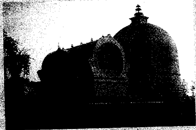
มหาปรัชญาปารมิตตาและมหาปรัชญาปารมิตตา ล่องหนูปึงกูกับปรัชญาปารมิตตาของ พระบรมศาสดาเจ้าโคตมสัมมาสัมพุทธเจ้า ณ ศาลาธรรมน พะยูงสีนา