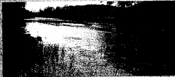
ภาพที่ ๔ - ทุ่งนาและสวนผลไม้ในเขตเมืองสุพรรณบุรี