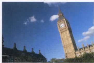
เป็นภาพที่เห็นชัดเจนในทุกระยะ ภายหลังจากได้รับการผ่าตัดเปลี่ยนเลนส์แก้วตาเทียมชนิดโฟกัสภาพหลายระยะ (Multifocal Lens)

แม้ว่าการมองเห็นจะเปลี่ยนไปตามวัย.... แต่ที่ศูนย์จักษุ...ไม่ว่าคุณจะมีอายุมากเพียงใด... เราช่วยการมองเห็นของคุณให้กลับมาเป็นหนุ่มสาวอีกครั้ง