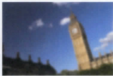
เป็นภาพของผู้ที่มีภาวะโรคต้อกระจก ก่อนเข้ารับการรักษา โดยร้อยละ 97% ของผู้ที่มีอายุ 60 ปีขึ้นไป มีโอกาสเสี่ยงเป็นโรคต้อกระจก