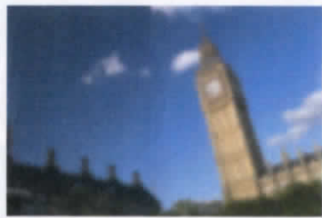
เป็นภาพของผู้ที่มีภาวะโรคต้อกระจก ก่อนเข้ารับการรักษา โดยร้อยละ 97% ของผู้ที่มีอายุ 60 ปีขึ้นไป มีโอกาสเสี่ยงเป็นโรคต้อกระจก