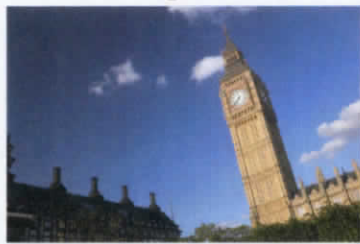
เป็นภาพที่เห็นชัดเจนในทุกระยะ ภายหลังจากได้รับการผ่าตัดเปลี่ยนเลนส์แก้วตาเทียมชนิดโฟกัส ภาพหลายระยะ (Multifocal Lens)