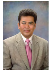
ดร.จรรยา ไชยศรี รองอธิบดีกรมประชาสัมพันธ์

การทำงานเป็นทีมเป็น แนวทางหนึ่งที่จะทำให้ งานบรรลุความสำเร็จ มี ประ ส ท ศ ิ ภาพ