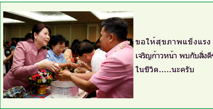
ขอให้สุขภาพแข็งแรง เจริญก้าวหน้า พบกับสิ่งดี ในชีวิต.....นะครับ