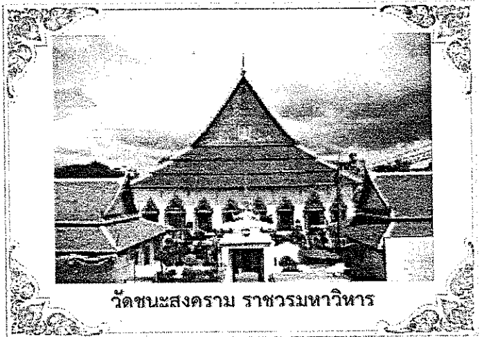
วัดชนะสงคราม ราชวรมหาวิหาร

ด้วย "ศาลปกครอง" ได้รับพระมหากรุณาธิคุณโปรดเกล้าฯ พระราชทานผ้าพระกฐินให้นำไปถวายพระสงฆ์จำพรรษา ณ พระอารามหลวงต่าง ๆ เป็นประจำทุกปี ซึ่งพิธีถวายผ้าพระกฐินพระราชทานนี้ จัดเป็นประจำและเป็นพิธีที่สำคัญทางพระพุทธศาสนา โดยถวายผ้าพระกฐินฯ แต่พระสงฆ์ที่จำพรรษา ณ วัดนั้น ๆ ได้ปีละครั้ง ในการร่วมบำเพ็ญบุญและร่วมอนุโมทนา "กฐิน" นับว่าเป็นบุญมหากุศลเป็นอันมาก ซึ่งพุทธศาสนิกชนทั้งหลายได้ปฏิบัติสืบต่อกันมา