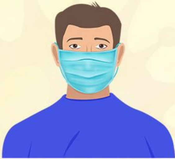
สวมหน้ากาก

ถึงแม้จะได้รับการฉีดวัคซีนแล้ว ก็ไม่ควรประมาท ยังคงต้องรักษามาตรการ