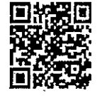
สิ่งที่ส่งมาด้วย ๓