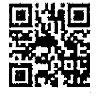
สิ่งที่ส่งมาด้วย ๔