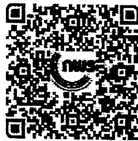
สิ่งที่ส่งมาด้วย ๒ KPI Basket