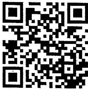
สิ่งที่ส่งมาด้วย ๑ และ ๓