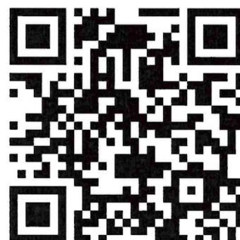
Link การประชุมชี้แจงระบบการจัดการ เรื่องร้องเรียน เปิดลงทะเบียนเวลา 11.00 น. ผ่านระบบ webex

https://prd.webex.com/join/prdconference