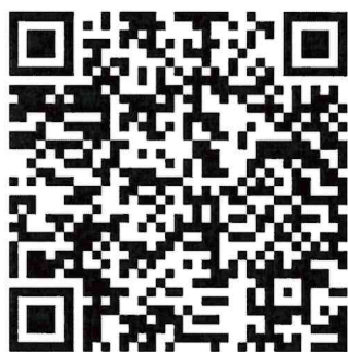
คู่มือการใช้ระบบการจัดการเรื่อง ร้องเรียนของกรมประชาสัมพันธ์

https://prd.webex.com/join/prdconference